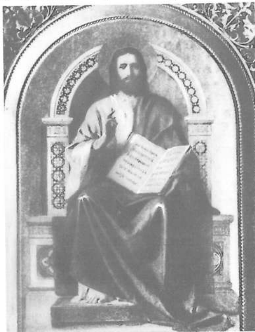
Mântuitorul pe iconostasul de la Zagreb de Bucevschi