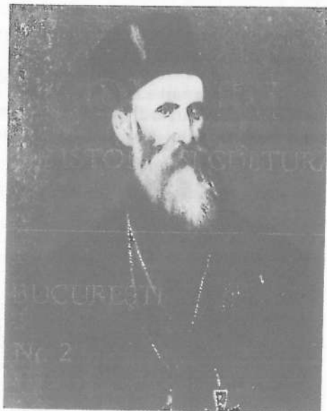
Mitropolitul Teofil Bendella de Bucevschi

Să revenim la biserica din Tereblecea (raionul Hliboca, regiunea Cernăuți), pe al cărei iconostas, în partea stângă de la ușa centrală a altarului, se află o minunată icoană a Maicii Domnului cu pruncul în brațe. Icoana este asemănătoare cu cea lucrată la Zagreb. Am putea presupune că ea a fost executată de mâna lui Bucevschi, deoarece din toate celelalte icoane restaurate, aceasta pare a păstra liniile academismului neoclasic al picturii bucevschiene, chiar dacă a avut de suferit de pe urma renovării, cum se mai poate observa în straturile de culori, aplicate peste pictura inițială. Naturaletea din privirea Maicii Mântuitoarei vrea să confirme gândul nostru,