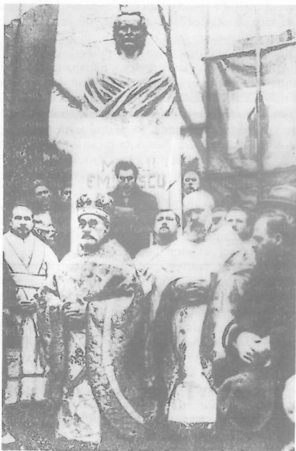
Bustul lui Mihai Eminescu din parcul „Arboroasa” din Cernăuți, dispărut într-o noapte din 1945