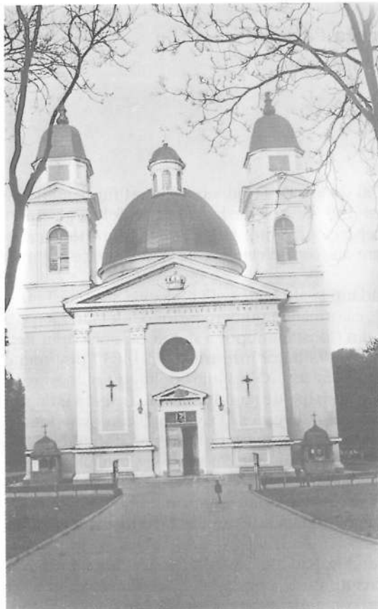
Catedrala ortodoxă din Cernăuți

Sucevița și Dragomirna cu câte 25 de călugări fiecare. Clerul bisericesc a fost organizat în 6 protopopiate și 2 vicariate: Cernăuți, Ceremuș, Nistru, Berhomet, Vicov și Suceava, cuprinzând 239 parohii cu 26. 731 familii, existând 247 biseerici cu 292 preoți. Toate moșiile mănăstirești au fost secularizate și trecute sub administrația statului, înființându-se la 19 aprilie 1783 Fondul Religionar care să administreze și