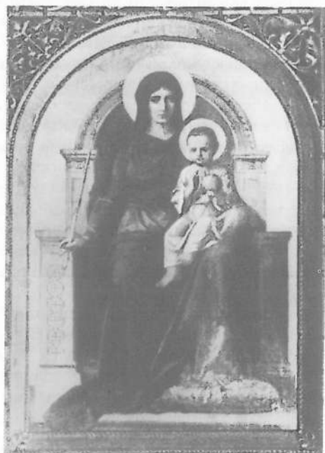
Maica Domnului (iconostasul de la Zagreb de Bucevschi

Acest canon, binecuvântat de biserică, în care trebuia să se încadreze arta, această atitudine față de frumosul inițial al naturii se manifesta mai pronunțat la popoarele creștine, care au avut o soartă istorică mai altfel decât cea a românilor. De aceea presupunem că sfinții și apostolii, înfățișați pe icoanele multor popoare creștine din evul mediu, nu mai corespundeau cerințelor unei societăți noi, chipurile lor fiind rigide, departe de a mai emana acel sentiment al iubirii față de semeni. Or, „... neamul românesc s-a plăsmuit între catastrofe istorice. De aceea el și-a concretizat forțele de creație în universul spiritualităților populare, în folclor, mai ales că majoritatea lui se constituia din plugari și păstori“ (4, 146). Astfel a supraviețuit acest popor. Chipurile zugrăvite pe icoanele și pe frescele românești sunt mai vii, mai milostive, ele exprimă sentimente mult mai calde în raport uman. „Românii au păstrat, au adâncit și au valorificat o viziune creștină a naturii, așa cum fusese ea exprimată în primele secole ale creștinismului“ (4, 147).