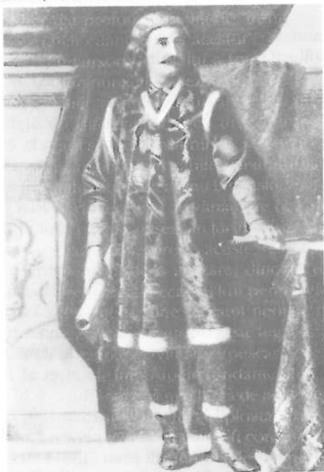
Ștefan cel Mare (după Evangheliarul de la Humor) de Bucevschi