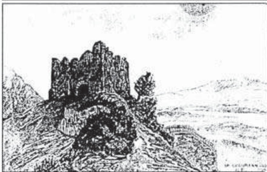
Cetatea Neamțului - acuarelă