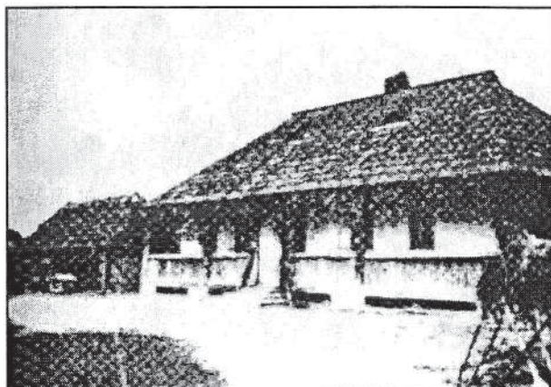
Casa Nandriș - 1938

Pavelescu a fost poate cel mai important pentru o anumită categorie de oameni. Acest Directorat a împărțit toate bunurile din Cernăuți și Bucovina, naționalizate sau rămase naționalizate de la ruși, în partea Bucovinei ocupată de ruși. Poate e bine să dăm o mică lămurire. În vremea regimului hitlerist s-au luat bunurile de la evrei și s-au numit naționalizate, adică date românilor sub diferite forme și titluri (fabrici, mari proprietăți, magazii, ateliere, întreprinderi, case, păduri, mori, farmacii, laboratoare, prăvălii, etc.) După eliberarea Bucovinei de miază-noapte, acolo s-a găsit o altă situație. Tot un fel de naționalizare sau socializare, sau comunizare – cum vrei să o numești – a tuturor proprietăților, fără deosebire de rasă. Și cum am amintit mai sus, o sumedenie de "californieni" (bucureșteni, olteni, ardeleni, bănățeni și mai puțini moldoveni și bucovineni) cu o cerere și un bilet de recomandare de la cineva mai mare din București au devenit peste noapte proprietari efemeri de