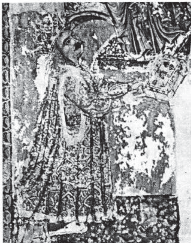
Ștefan cel Mare și Sfânt Fragment din "Tetraevangheliarul din 1473"

Personalitatea domnitorului Ștefan cel Mare, prin întinsa sa domnie de „47 de ani, 2 luni și 3 săptămâni” – socoate Grigore Ureche – lucru unic în istoria Moldovei, dar mai ales prin atâtea războaie cu greu câștigate, prin citorisirii de biserici, mănăstiri, conace, prin iscusință diplomatică, prin simțul dezvoltat de justiție etc. a impresionat puternic pe contemporanii moldoveni, pe vecini și... pe un papă de la Roma. Și pe istorici!