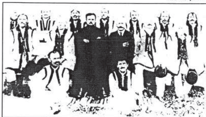
1939 - Epitropii bisericii din Hurjuieni