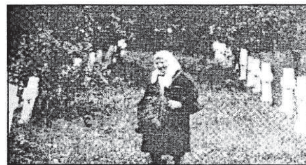
Pe care-l cauți, măicuță?