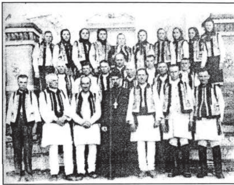
Corul bisericii din Mahala - 1961 - de Rusalii

Acum, după 60 de ani, putem cântări fiecare, dacă temerile lui au fost justificate.