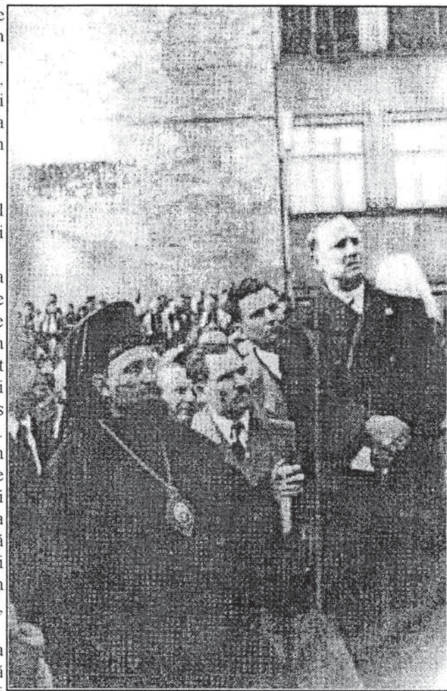
Grigore Nandriș și Mitropolitul Bucovinei Visarion Puiu la punerea Uricului de fundație și sfințirea Palatului Cultural

Un alt aspect urât a fost apariția unei categorii de cumpărători de valori de ocazie. Se vede că au fost informați de prieteni, rude cu servicii prin Cernăuți că aici se pot cumpăra lucruri de valoare la un preț mic. E adevărat că evreii vindeau diferite lucruri, fiindcă că aveau nevoie pentru viață și o parte cunoșteau moravurile noastre și cu bani au reușit mulți să plece în Palestina și în timpul dictaturii mareșalului Antonescu. Și atunci vedeai oameni (medici, avocați, funcționari, etc.) veniți din interiorul țării la Cernăuți, cu trenul, cu mașini proprii, toți având prieteni sau rude noi și cumpărând cu ajutorul misișilor evrei tot felul de lucruri: blănuri, bijuterii, briliante, stoffe, aur, servicii de masă, lenjerie, pian, etc. Îi vedeai în urma misișilor intrând dintr-o casă, în alta, alții mai simandicoși primeau