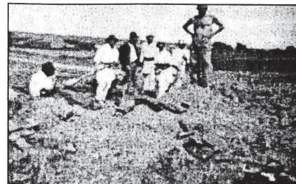
Săpături arheologice, în Mahala (1938)