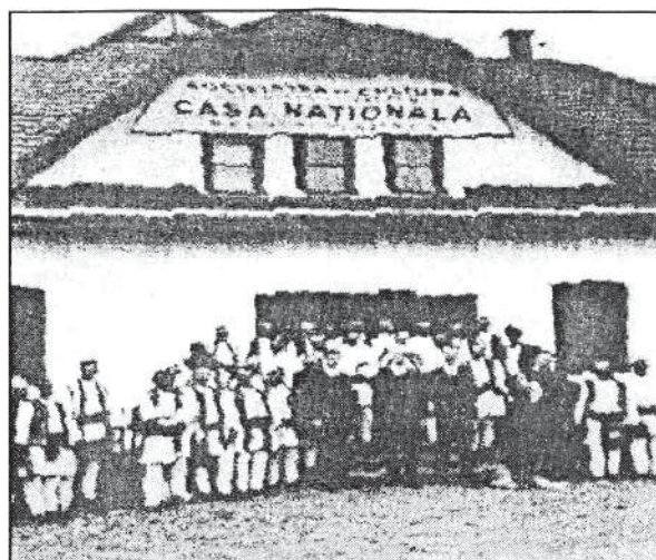
Aspect de la sfințirea Casei Naționale (24.10.1937)